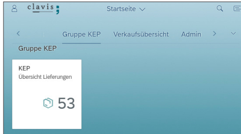
Kachel im SAP Fiori Launchpad